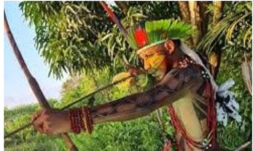
Figura 1: Akuã Mc