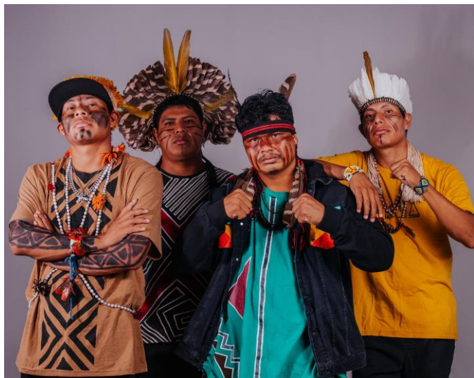
Figura 3: Bro Mc's