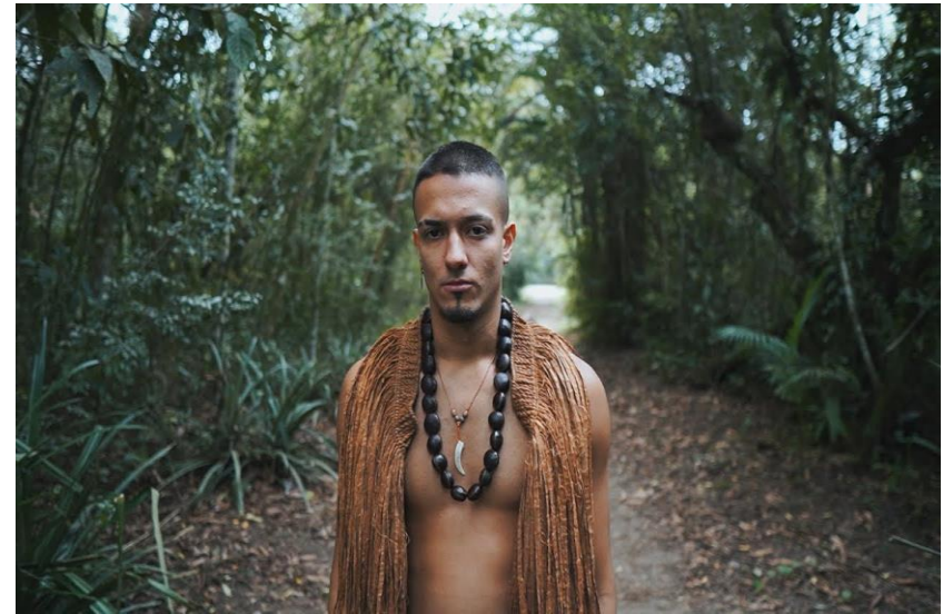
Figura 4: Wescritor