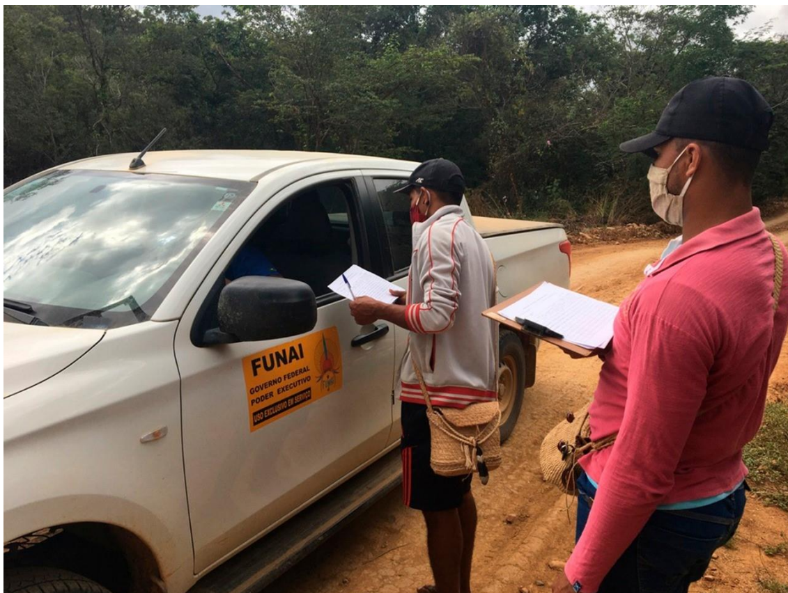
Figura 14: Experiência teste para aplicação das fichas do Monitoramento Comunitário Xakriabá – Foto: Edgar Corrêa Kanaikô, 2020.

Para a tabulação, ou seja, lançamento dos dados coletados, foi criada uma planilha no sistema Excel, sendo que a representação abaixo foi a última versão, já que anteriormente foram criadas e utilizadas outras três para que se chegássemos a essa versão considerada ideal. A planilha tem o seguinte modelo abaixo: