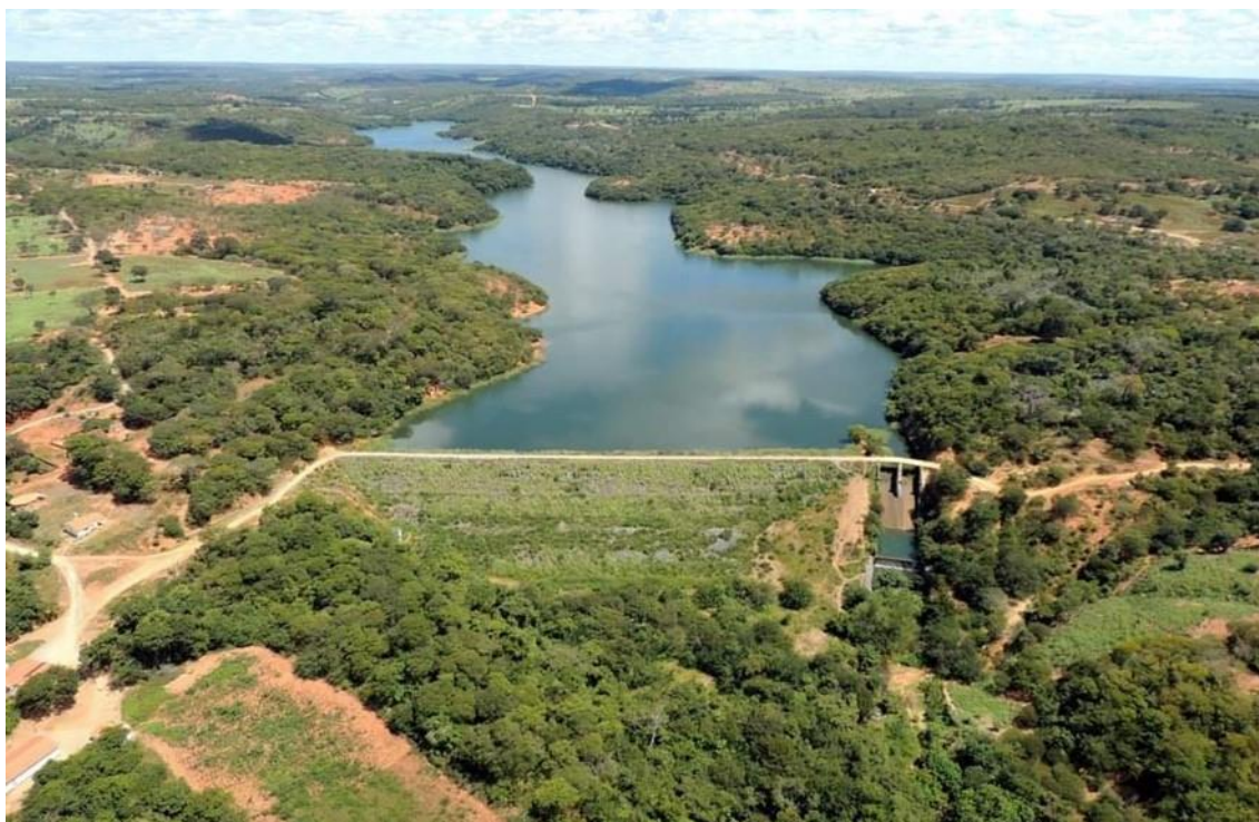
Figura 3: Barragem na Aldeia Itapicuru, divisa entre a Terra Indígena Xakriabá São João das Missões e Manga – Fotos: Manoel Freitas Jornalista

Em outro momento, posterior à demarcação do território, em meio a luta do povo Xakriabá que se intensificava cada vez mais, surge no ano de 1985 o projeto hídrico Barragem Itacarambi, no até então município de Itacarambi. A capacidade de 310.186m 3 de água, visava assegurar o volume sendo controlado manualmente a vazão para o rio.