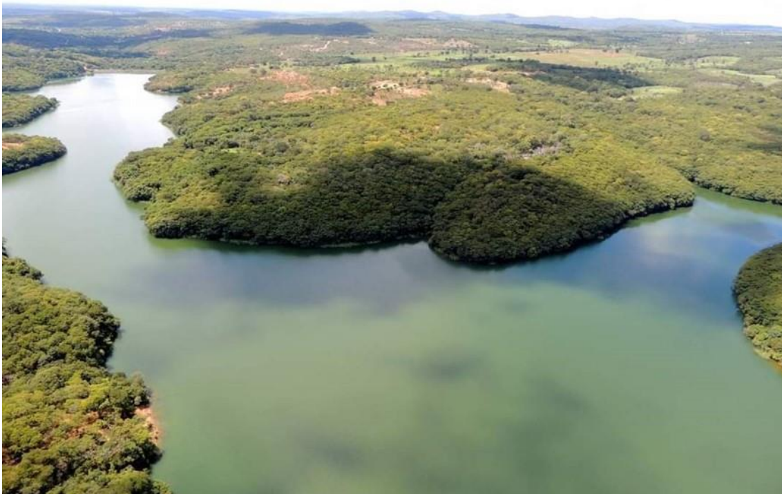
Figura 4: Barragem na Aldeia Itapicuru vista de cima

Construída na década de 80 pela CODEVASF (Companhia de Desenvolvimento do Vale do São Francisco), o reservatório, ou barragem como a população aqui chama, tem um papel fundamental na questão da sustentabilidade tanto da população, quanto da vazão de água do Rio Itacarambi que percorre aproximadamente 100 quilômetros, passando por aldeias e comunidades não indígenas até desaguar no Rio São Francisco. A barragem é basicamente um símbolo da aldeia e até mesmo do Território Xakriabá. Muitos dos indígenas Xakriabá têm como uma das principais fontes de renda e alimentação, a pesca que é retirada desta barragem.