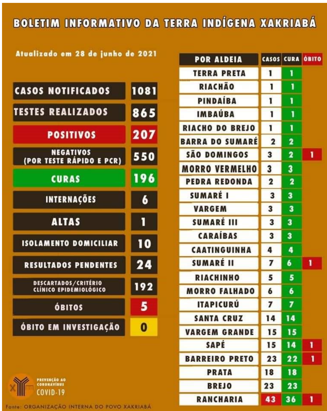
Figura 16: Boletim informativo da Terra Indígena Xakriabá – Fonte: Organização Interna do Povo Xakriabá. Atualização em 28 de junho de 2021.