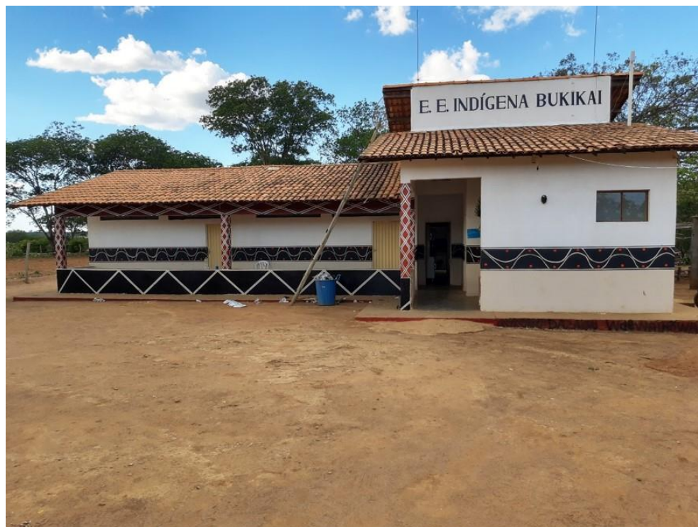
Figura 7: E.E Indígena Bukikai, Aldeia Itapicuru