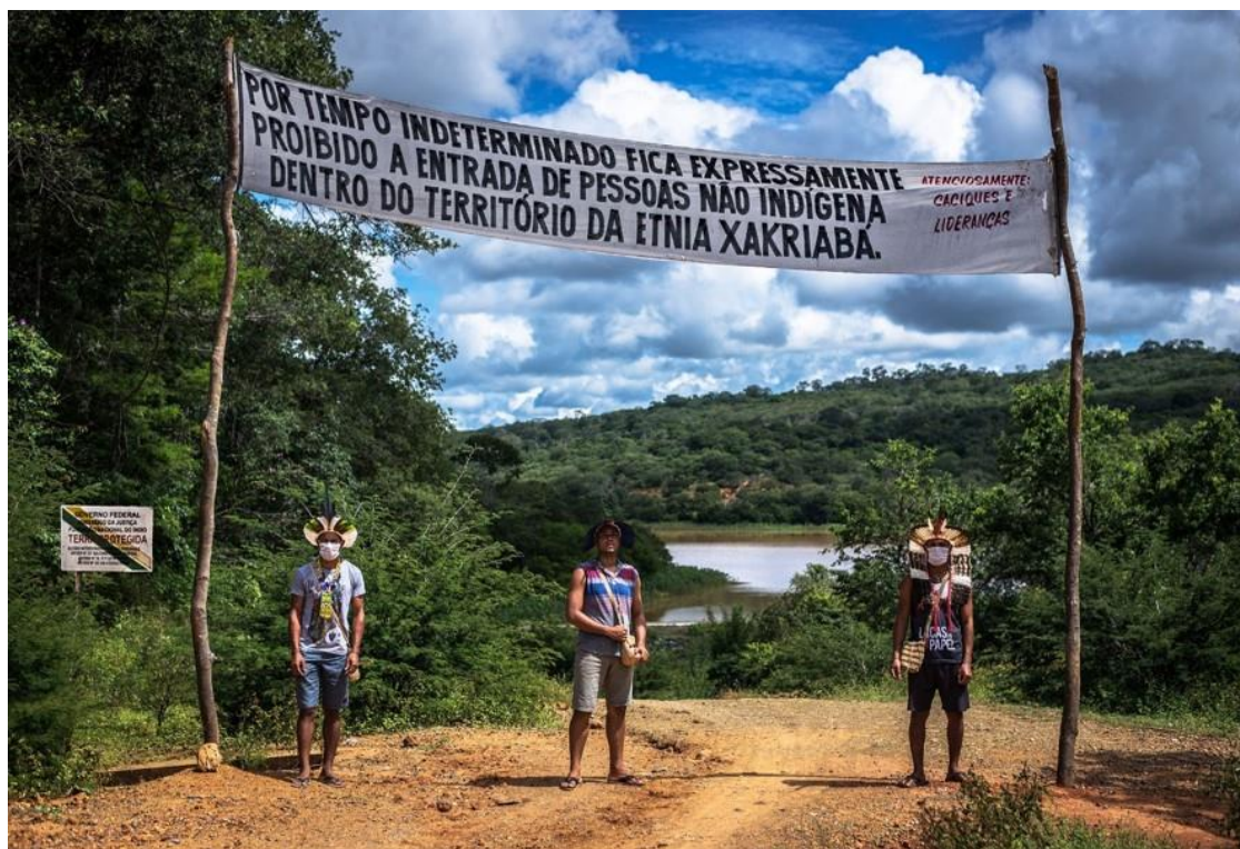
Figura 9: Faixa de aviso no acesso aldeia Itapicuru, representando uma das primeiras ações realizada.

Um segundo momento/etapa desse movimento para restringir o acesso ao território foi feito alguns dias depois, com o objetivo de fortalecer a proteção do nosso povo. Devido às informações de que o avanço da pandemia se tornava cada vez mais alarmante, essas iniciativas visavam orientar o nosso povo quanto à preocupação para que não surgissem indígenas do nosso povo infectado. Barrar a entrada de pessoas estranhas, bem como restringir o acesso até mesmo àquelas pessoas que tinham fácil acesso e muitas delas conhecidas pelo fato de ter várias comunidades não indígenas que se relacionam com o nosso território. Essa segunda etapa se consolidou na colocação de cancelas e correntes em nove das entradas; em algumas delas foram montadas contenções com terra e cercas bloqueando a passagem. Os próprios guerreiros e guerreiras faziam a vigia em tempo integral das entradas. Se dividiam por aldeia, ou por região do território.