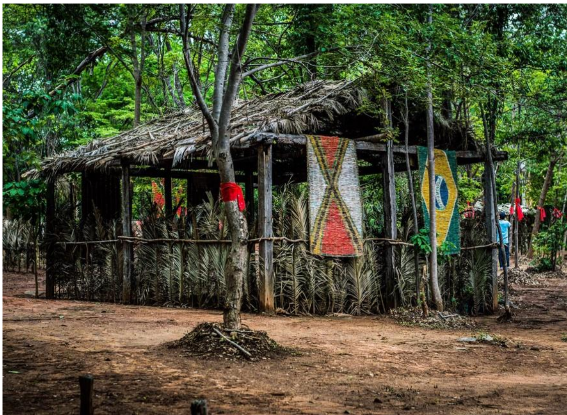
Figura 6: Casa do Cacique Rosalino que estava em construção

contam que os conflitos eram constantes na aldeia, pois boa parte dos grileiros de terra se apossaram de terras nessa localidade. Segundo relatos, dificilmente os indígenas dormiam em suas casas por medo de serem mortos. Durante o dia os moradores iam até suas casas somente para alimentar os animais e dar água.