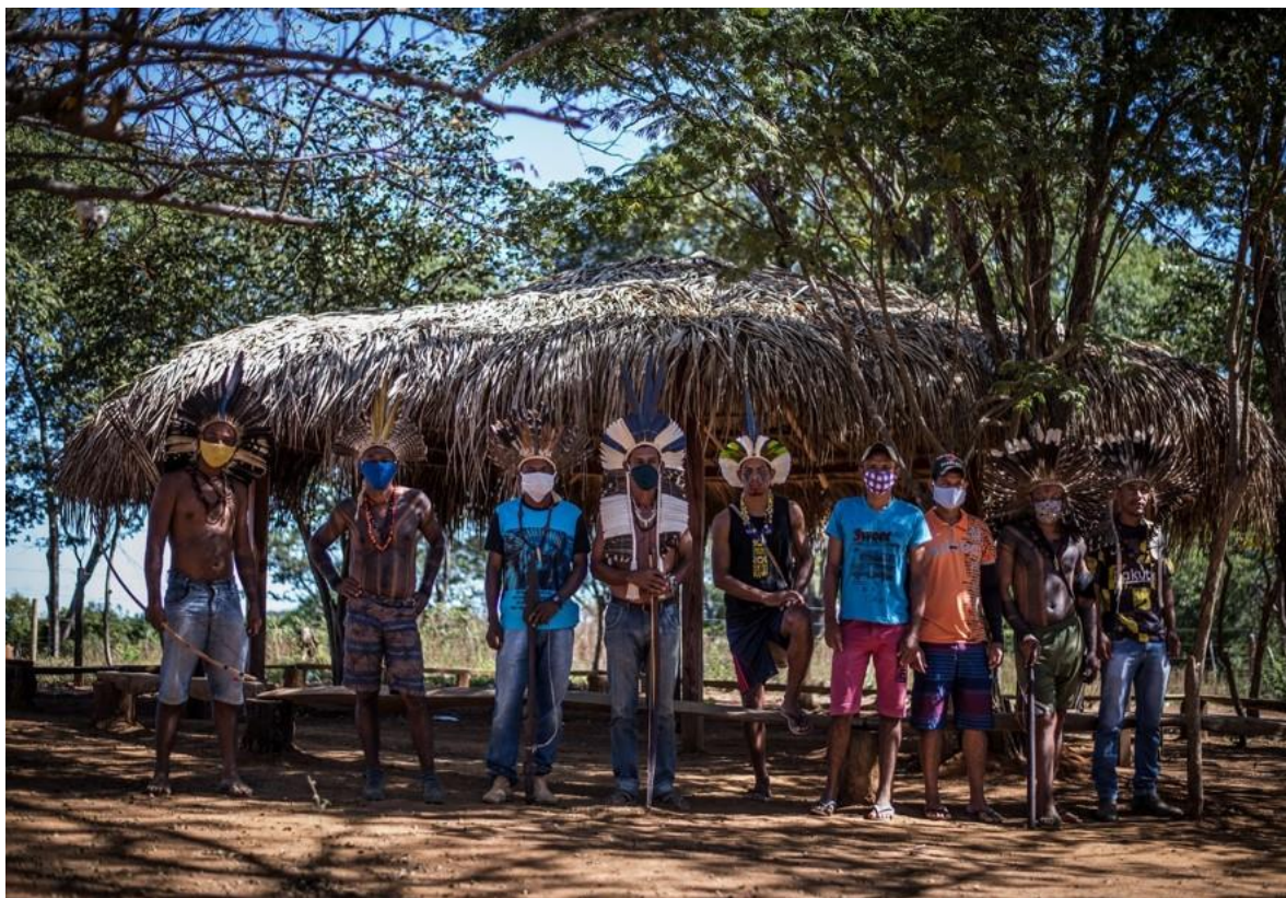
Figura 10: Um dos grupos de guerreiros Xakriabá atuando nas barreiras– Foto: Edgar Corrêa Kanaikõ, 2020.

Todos nós vivemos uma modificação significativa em nossas vidas. Tudo mudou drasticamente num piscar de olhos. Hábitos, costumes, vivências socioespaciais, confraternizações e até mesmo os nossos rituais coletivos. Hoje em dia, com tudo isso que temos passado, temos ficado mais tempo com nossa família, mas também temos perdido tempos preciosos. São tempos em que ficamos estarecidos com escancaramento das desigualdades sociais presentes no nosso país, que até então era mascarada pelo fascismo, pelo negacionismo, pela incompetência de um desgoverno negando nosso direito, alimentando o ódio, a invasão de nossos territórios mesmo em tempos de pandemia e autorizando o genocídio de nossos parentes indígenas praticamente todos os dias. É também um etnocídio, pois nossos anciões são nossos troncos, nossa bibliografia viva: uma vez autorizado isso, mata-se também as nossas histórias, nossas culturas.