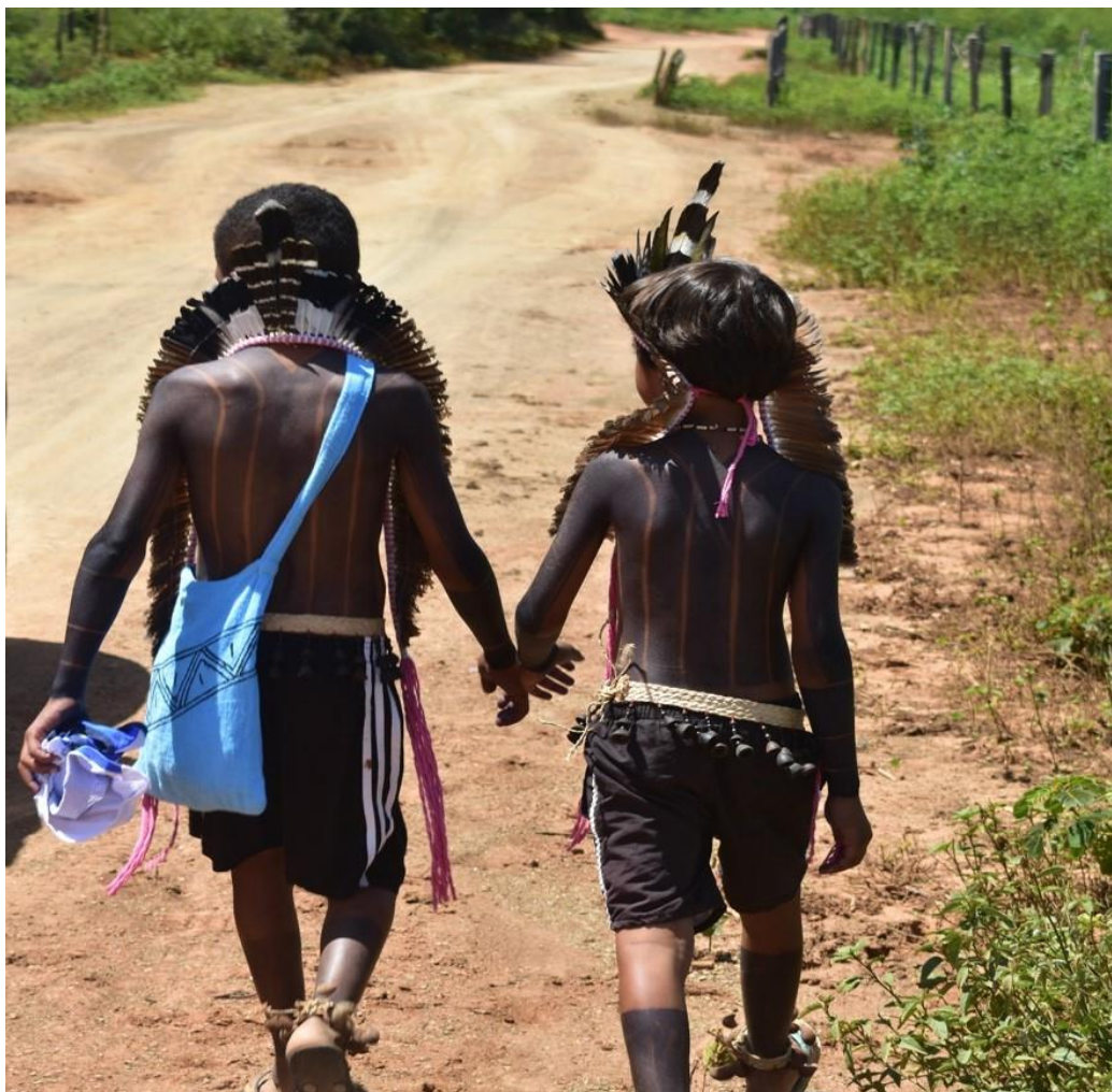
Figura 8: Aikte Xakriabá (Crianças Xakriabá) no movimento em memória dos mártires na aldeia Itapicuru – Foto: Edvan Srêwakmôwê Xakriabá 2018

A foto acima foi tirada durante a caminhada que faz parte do movimento que acontece todo ano dia 12 de fevereiro para relembrar a luta de nossos ancestrais. As duas crianças lideravam a frente da caminhada.