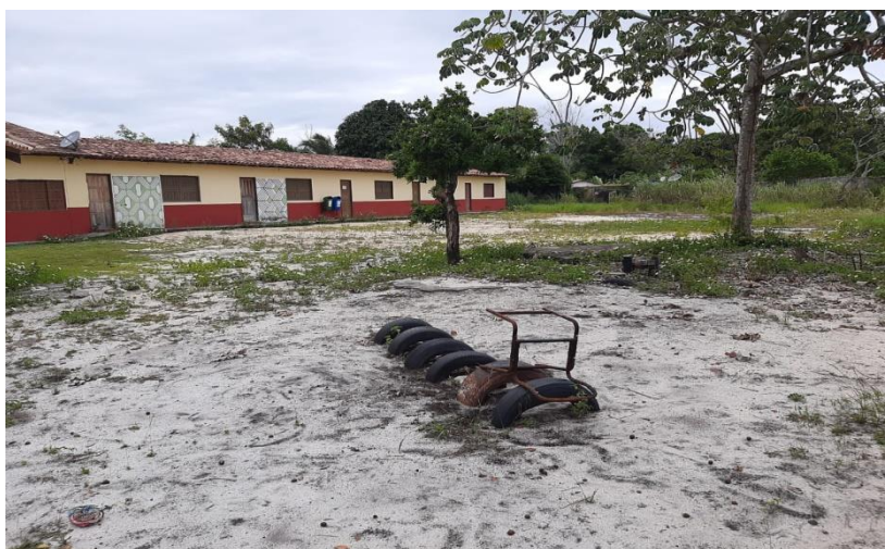
Figura 3: Salas de aula Educação Infantil Fonte: Ana Clara, 2021.

A escola oferece Educação Escolar Indígena - Específica e Diferenciada, o calendário escolar dessa instituição é um calendário diferenciado, organizado pelos gestores, professores da escola e a comunidade escolar, as etapas de ensino oferecida na escola são: Educação Infantil, Ensino Fundamental dos anos iniciais e finais e Educação de Jovens e Adultos (EJA). Os períodos de funcionamento da escola são matutinos, vespertino e noturno. As turmas são formadas por série, mas nas extensões as salas são multisseriadas.