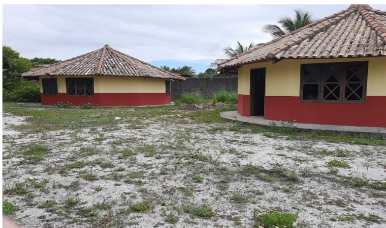
Figura 4: Salas de aula Ensino Fundamental I