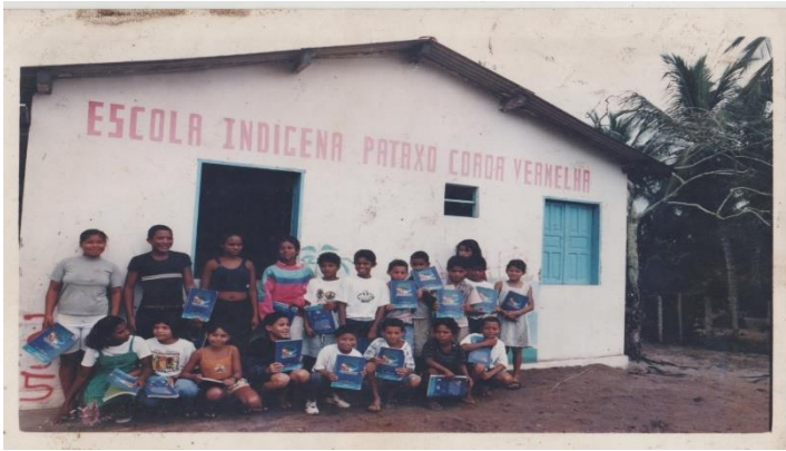
Figura 1: Imagem da Escola Indígena Pataxó Coroa Vermelha

No ano de 1996, a Escola Indígena Pataxó Coroa Vermelha iniciou com a sua própria gestão escolar: diretora, secretária escolar e serviços gerais, pois nos últimos anos, não tinha gestão, só tinha as professoras e as pessoas de apoio, e ela era gestada pelo órgão competente, antes era a FUNAI, pela coordenação escolar e logo depois pelo município, especificamente pela secretaria de educação. Percebemos um grande avanço para educação escolar indígena quando assumimos a gestão escolar.