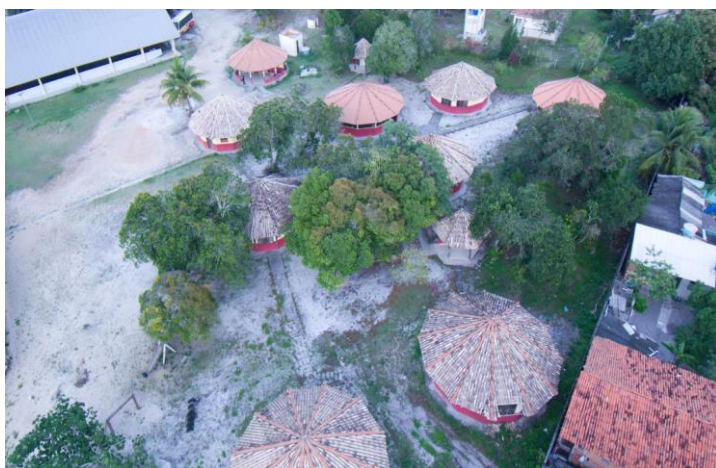
Figura 2: Foto panorâmica da Escola Indígena Pataxó Coroa Vermelha

Os espaços onde a escola funcionava antes da celebração dos 500 anos foram destruídos para a construção do parque e, no início do ano 2000, mudamos para a escola nova, uma escola que tínhamos sonhado tanto em tê-la. Essa fica localizada nas margens da BR 367 KM 06, dentro do Conjunto Cultural Pataxó (Centro Administrativo) na Aldeia Indígena Pataxó Coroa Vermelha, Município de Santa Cruz Cabrália - Bahia.