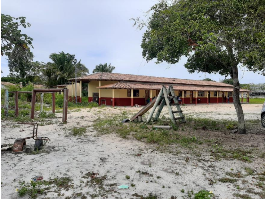
Figura 5: Salas de aula Ensino Fundamental II

As disciplinas oferecidas mudam durante o ano/série: na Educação Infantil: linguagem oral e escrita, matemática, natureza e sociedade, artes visuais e música, educação física/movimento, identidade e autonomia e língua Pataxó; Ensino fundamental (1º ao 5º ano): língua portuguesa, matemática, ciências, geografia, história, educação artística, educação física e língua Pataxó; Ensino fundamental (6º ao 9º): língua portuguesa, matemática, ciências, geografia, história, educação artística, educação física, língua estrangeira moderna Inglês e língua Pataxó; Educação de Jovens e Adultos- EJA: língua portuguesa, matemática ciências, geografia, história, educação artística, língua estrangeira moderna inglês e língua Pataxó.