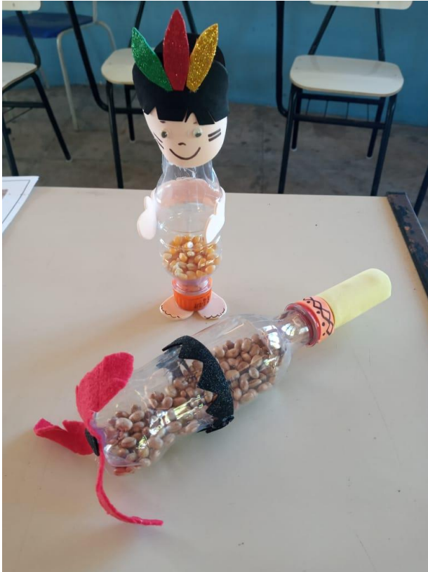
Figura 7: Chocalhos sensoriais.