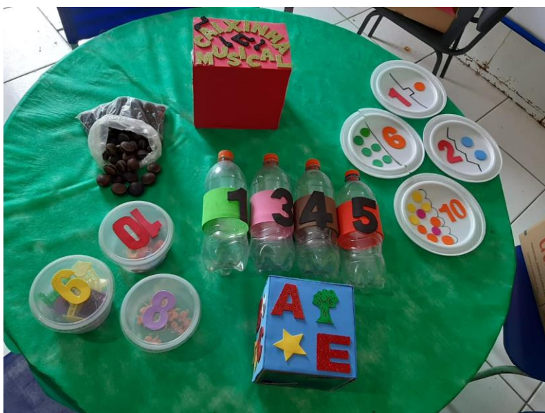
Figura 6: Caixa musical, boliche, sementes, caixa alfabética, número e quantidades.

Para desenvolver o trabalho com os alunos a professora utiliza jogos pedagógicos feitos com materiais reciclados e outros que foi doação que a escola recebeu, adaptando as aulas de acordo com o planejamento individualizado do aluno. Nas figuras a seguir apresento alguns recursos e atividades da sala de recursos.