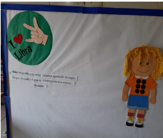
Figura 10: Rotina diária e numerais.