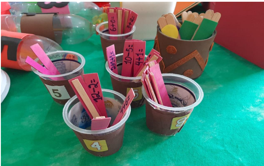
Figura 8: Jogo de adição e subtração com palitos de picolé.