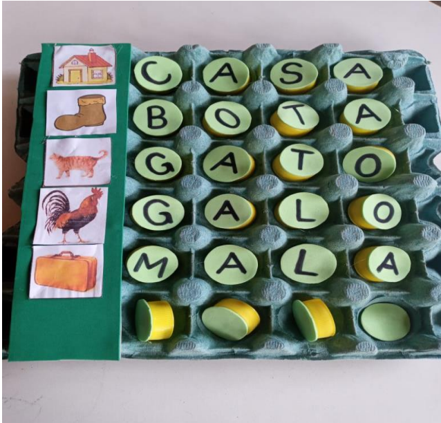
Figura 11: Formação de palavras com imagens, na cartela de ovos.

Até o momento estamos aguardando a liberação do recurso de acessibilidade do FNDE (Fundo Nacional de Desenvolvimento da Educação) para a compra de materiais adaptados e suas tecnologias assistivas. Enquanto isso, nosso trabalho vem sendo com esses materiais de sucata, sementes e reaproveitamentos de outros materiais que não são mais utilizados, dessa forma podemos reciclar e proteger o meio ambiente, apesar de sentirmos a falta e necessidade de desenvolver um melhor atendimento, com a falta desses materiais específicos para atender cada especificidade que o aluno apresenta.