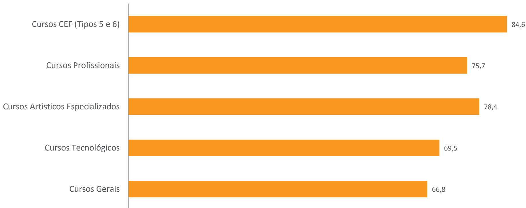
Taxa de Conclusão do Ensino Secundário por Modalidade de Educação/Formação (2009-2010)

Em 2009/10, os jovens de 15 anos alcançaram efectivamente os 100% de escolarização, mas 43% ainda permanece no ensino básico e apenas 57% se encontra no nível adequado à sua faixa etária - o secundário.